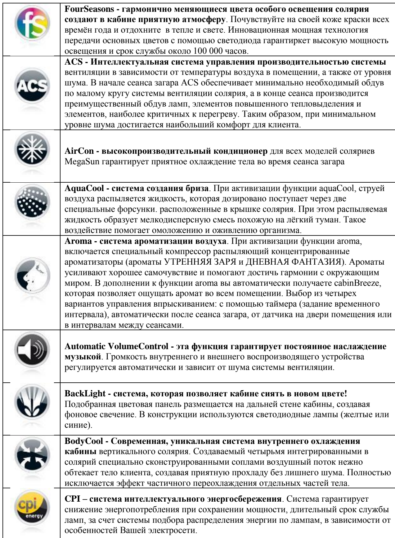
Таблица описания опций соляриев MegaSun